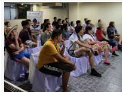
Cumbre Nacional 25 Delegados