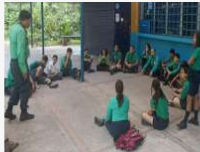
Cumbre Regional 360 Delegados