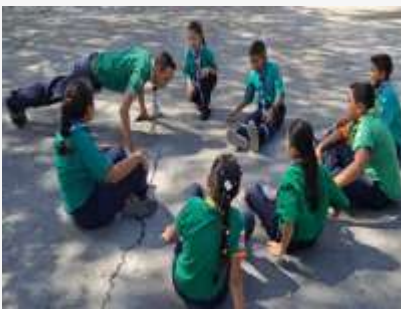
Cumbre Local 2823 Jóvenes